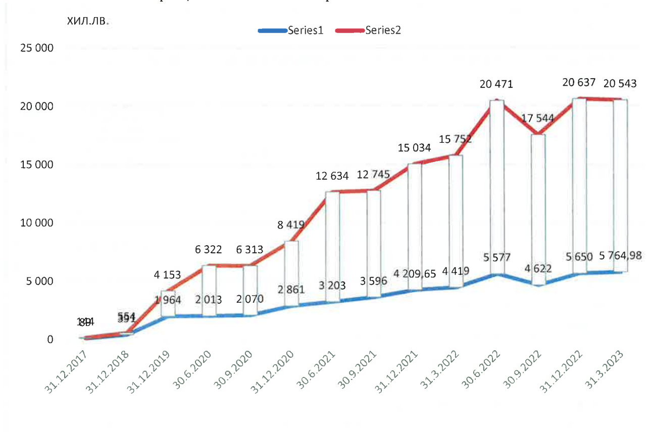
Възвращаемост на инвестиция капитал към 31.03.2023г.

Имайки предвид, че Дружеството няма приходи от основна дейност с изключение на дивиденди и лихви от компаниите от портфолиото и такива от преоценки на финансовите активи, които притежава, традиционните измерители за рентабилност, ликвидност, платежоспособност и ефективност не биха дали необходимата обстойна информация за състоянието на Ейч Ар Кепитъл Ад на потенциалните инвеститори.